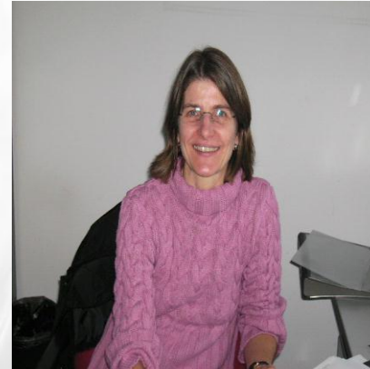
Renate Schock Geschäftsstelle